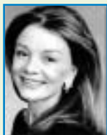
Dr. Sylvia Ann Hewlett

To celebrate National Children's Day in October, The Children's Trust is hosting the first annual awards ceremony to honor individuals for exemplary achievements on behalf of children in Miami-Dade County.